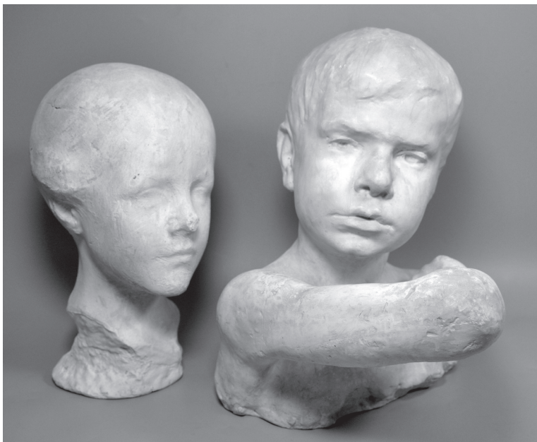
20. gs. sākumā tēlnieka N. Aronsona veidotie krūšutēli

Šī gada 13. novembrī Ludzas Novadpētniecības muzejs nodeva Krāslavas novada muzejam divus Nacionālā muzeju krājuma priekšmetus – Nauma Aronsona skulptūras – krūšutēlus „Lauku zēns”, 20. gs. sāk., ģipsis 22 x 18 x 24 cm un „Lauku zēns”, 20. gs. sāk., ģipsis, 26 x 24 x 34 cm.