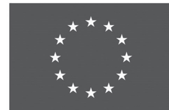
Finansē Eiropas Savienība

penē, Ezerniekos, Šķaunē, Indrā, Priežmalē un Krāslavas pilsētā. Savukārt Lietuvas kolēģi praktizēja ielu mobilo darbu ar jaunatni vietu nosaukumus Visaginas pilsētā un Zarasai apgabalā. Mobilā darba ieviešanas laikā jauniešiem bija iespēja arī pašiem organizēt savas iniciatīvas/pasākumus. Tie bija dažādi, un iecienītākie no tiem: pārgājieni, ekskursijas, radošās darbnīcas, galda spēļu un video spēļu vakari. Lai jauniešu iniciatīvas īstenotos veiksmīgāk un droši, mobilais jaunatnes darbinieks bija jauniešiem kā atbalsta persona. Rezultātā noteiktās teritorijās, kur iepriekš netika veikts sistemātisks darbs ar jaunatni, jaunatnes darbiniekiem izdevās sasniegt šīs aktivitātes galveno mērķi: tika izveidota jauniešu iniciatīvu grupa/aktīva jauniešu kopiena, kas zināja, ka noteiktā laikā